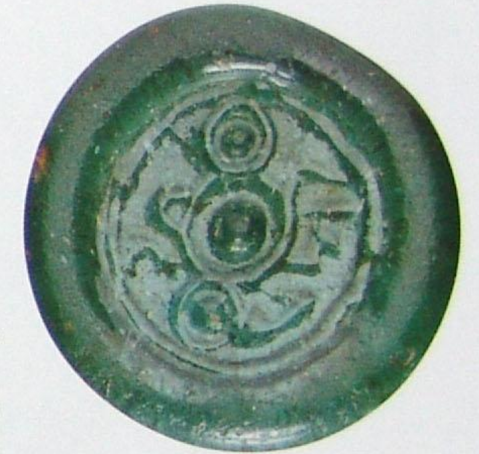
صنع زجاج فاطمية المستنصر بالله